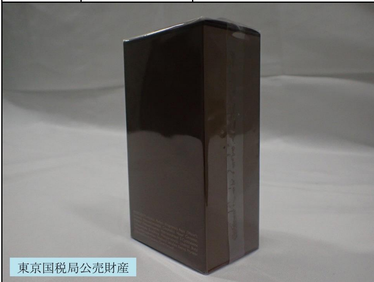
東京国税局公売財産