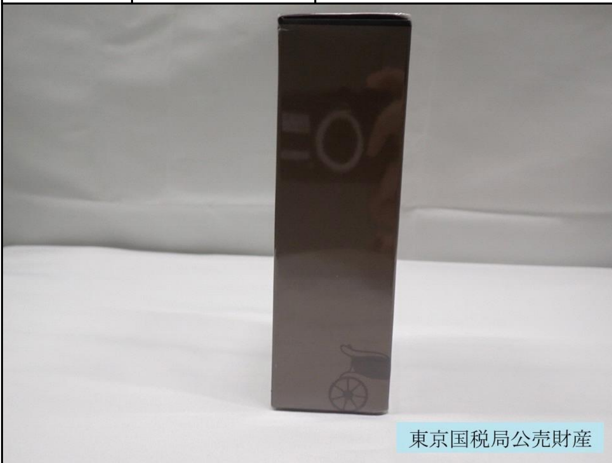
東京国税局公売財産