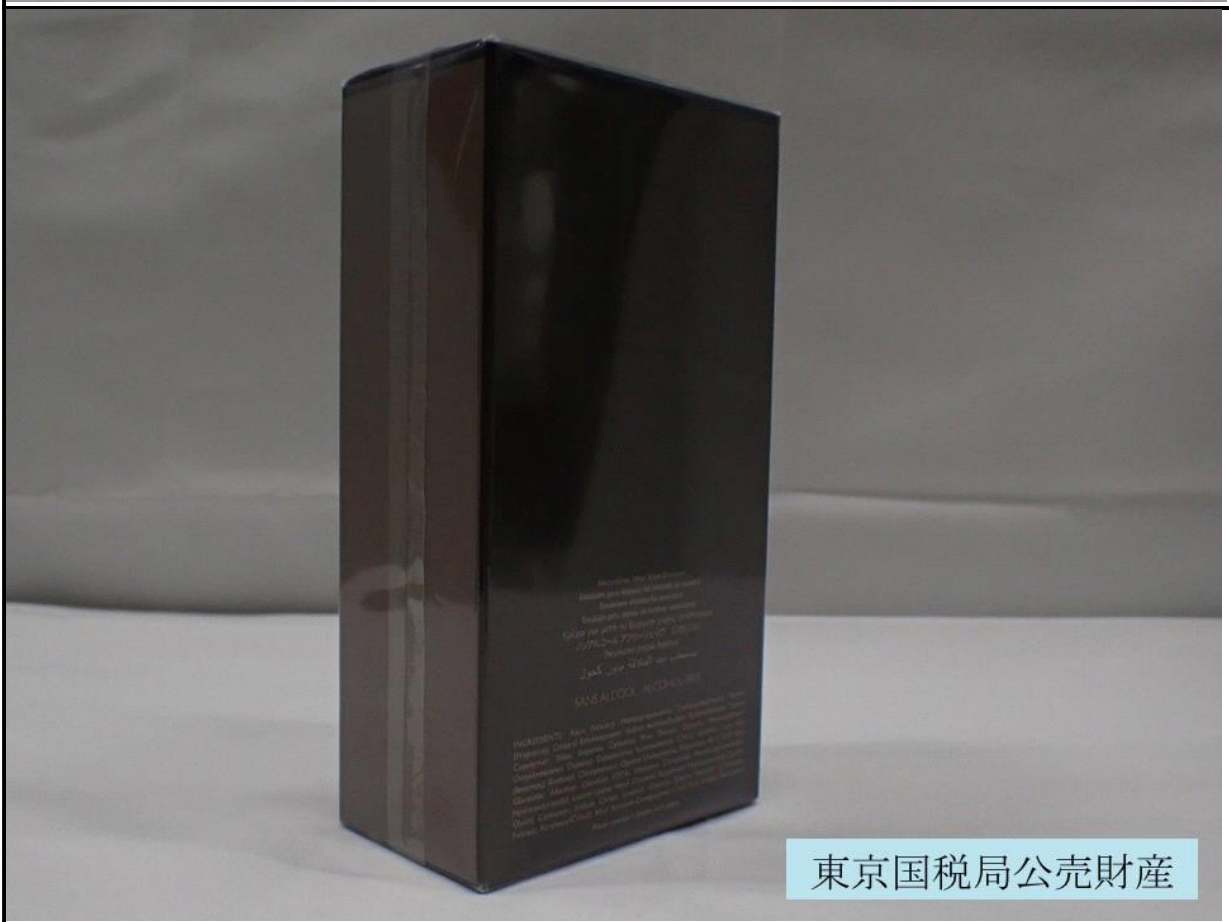
東京国税局公売財産