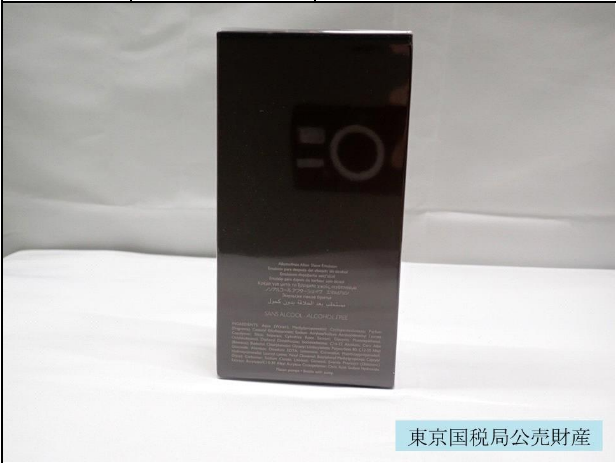
東京国税局公売財産