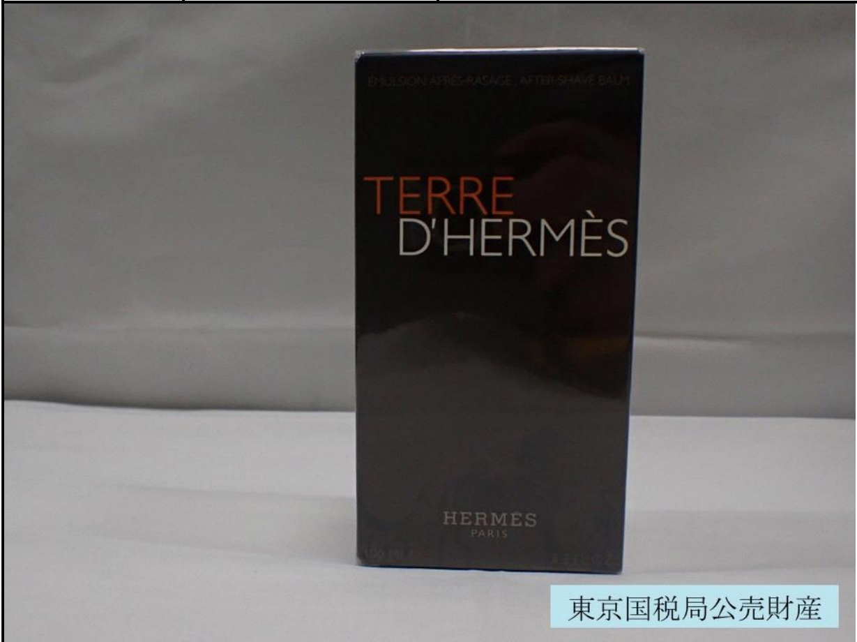
東京国税局公売財産