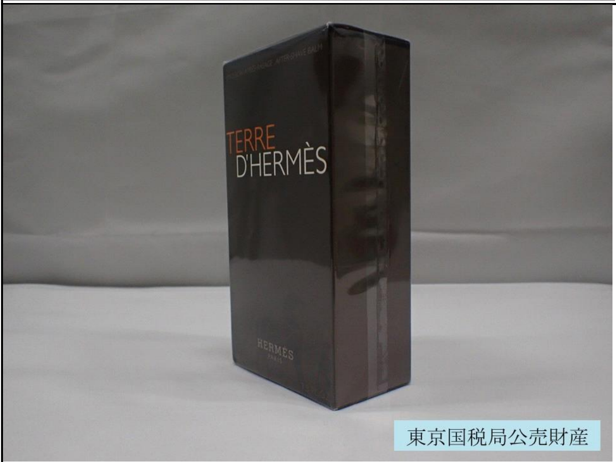
東京国税局公売財産