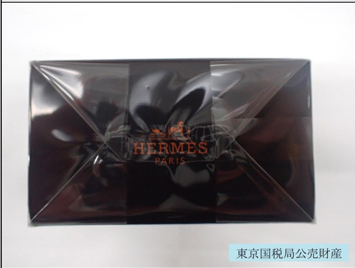
東京国税局公売財産