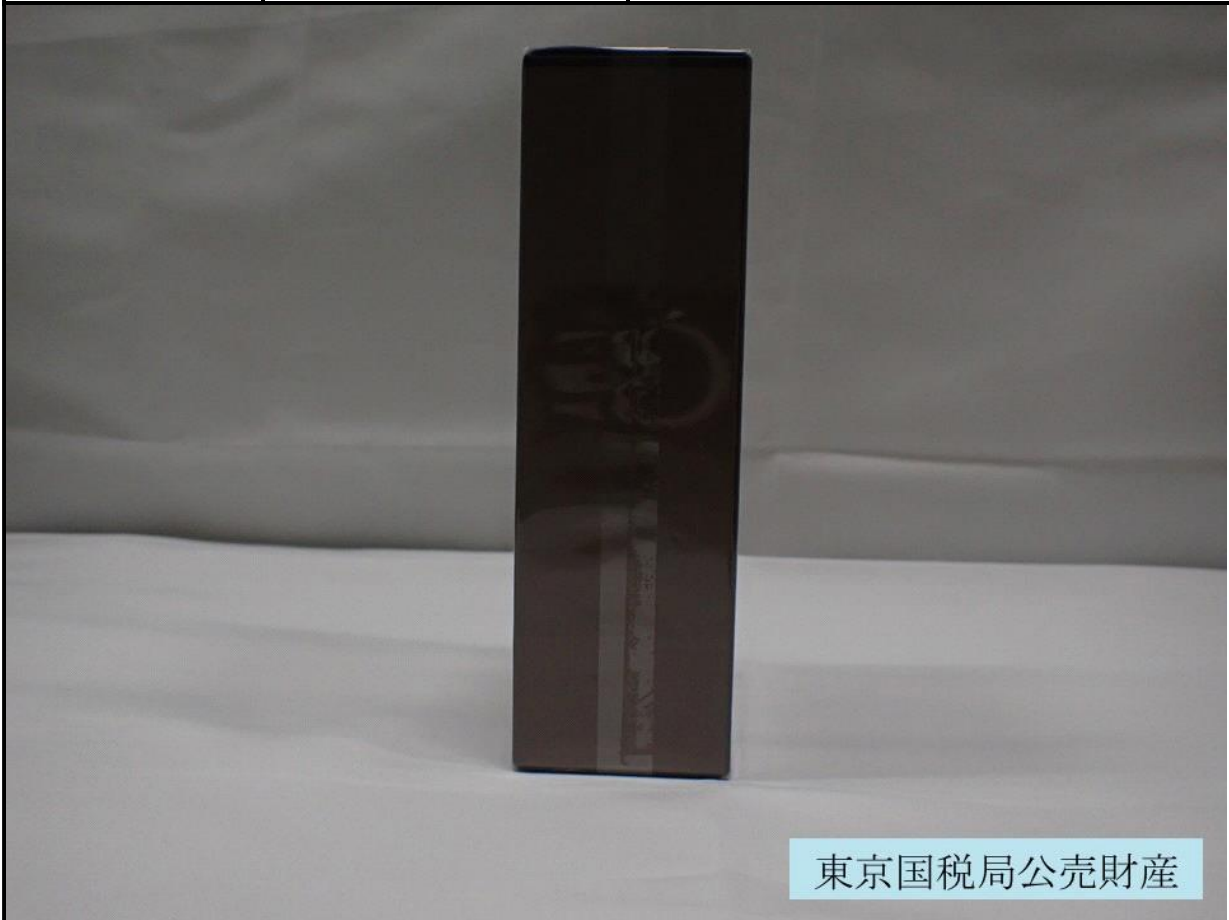
東京国税局公売財産