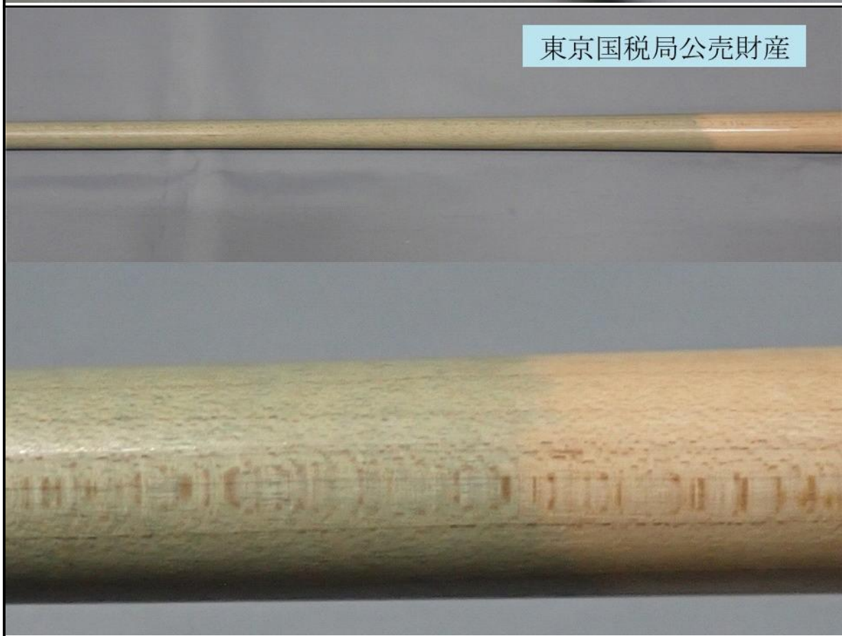
東京国税局公売財産