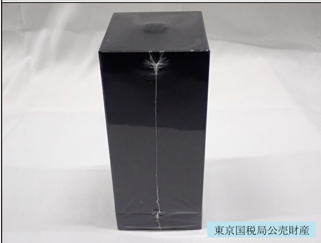
東京国税局公売財産