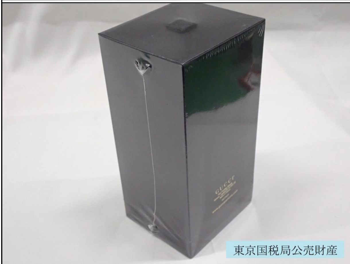
東京国税局公売財産