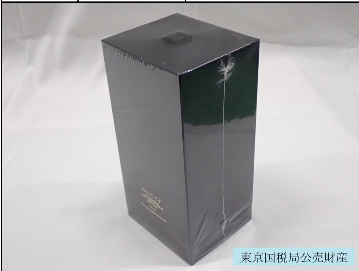
東京国税局公売財産