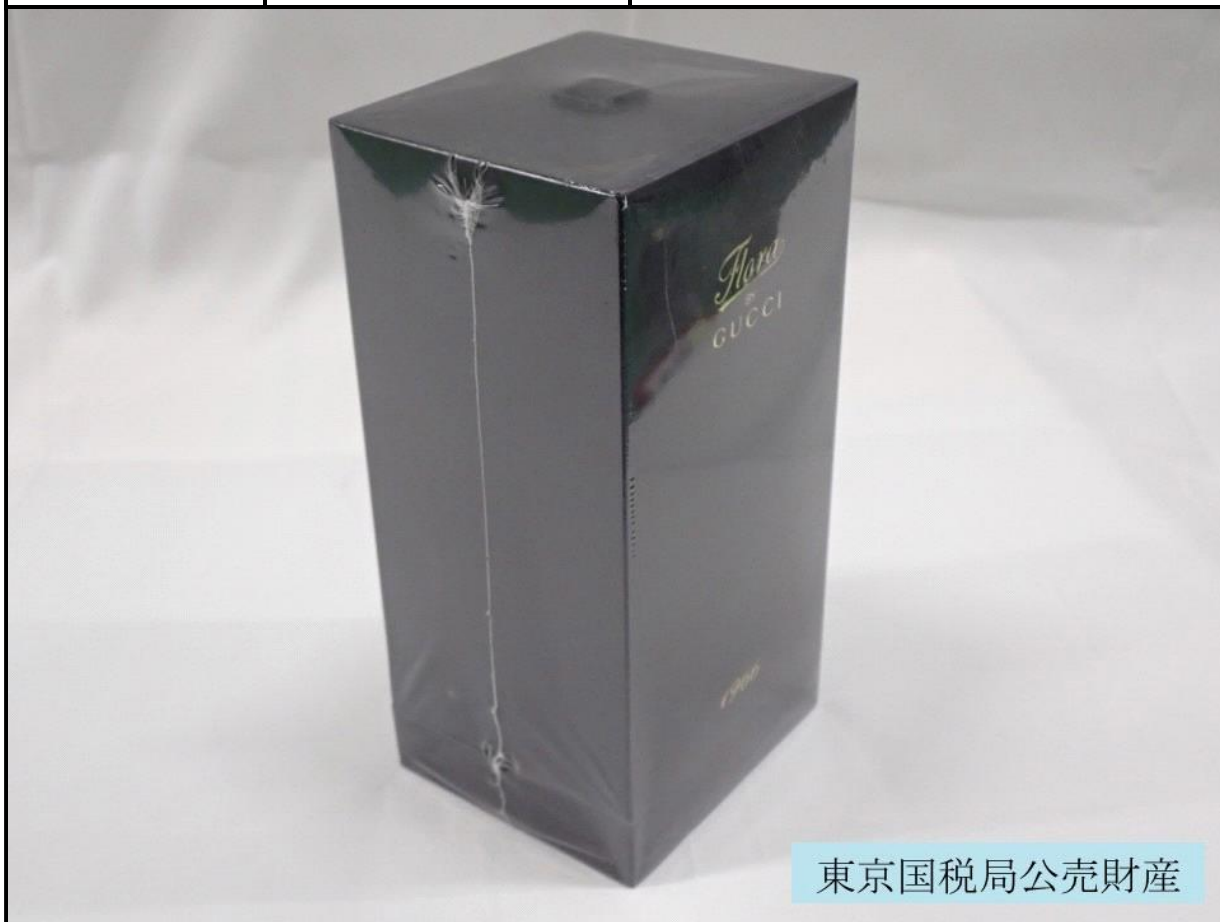
東京国税局公売財産