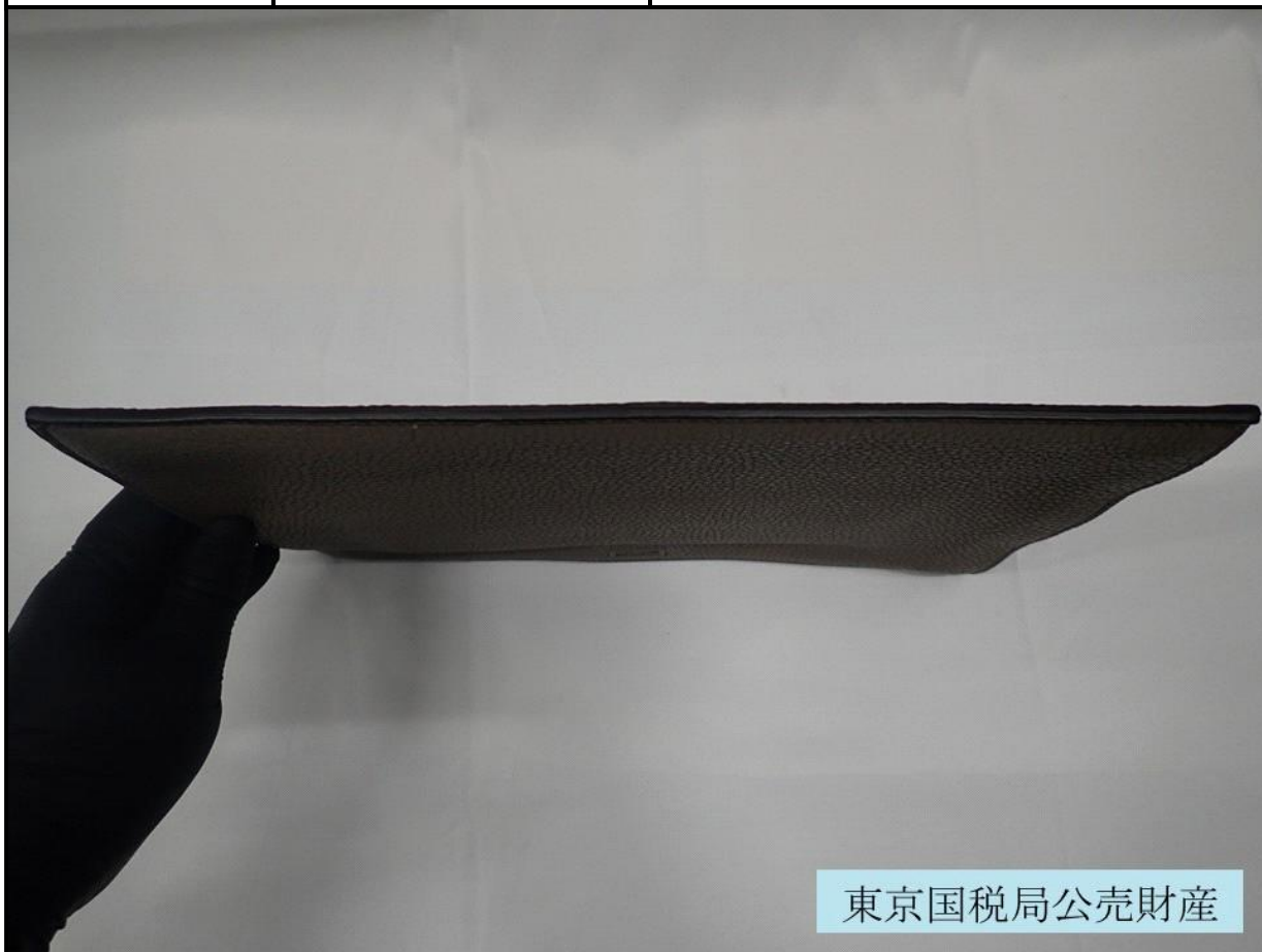
東京国税局公売財産