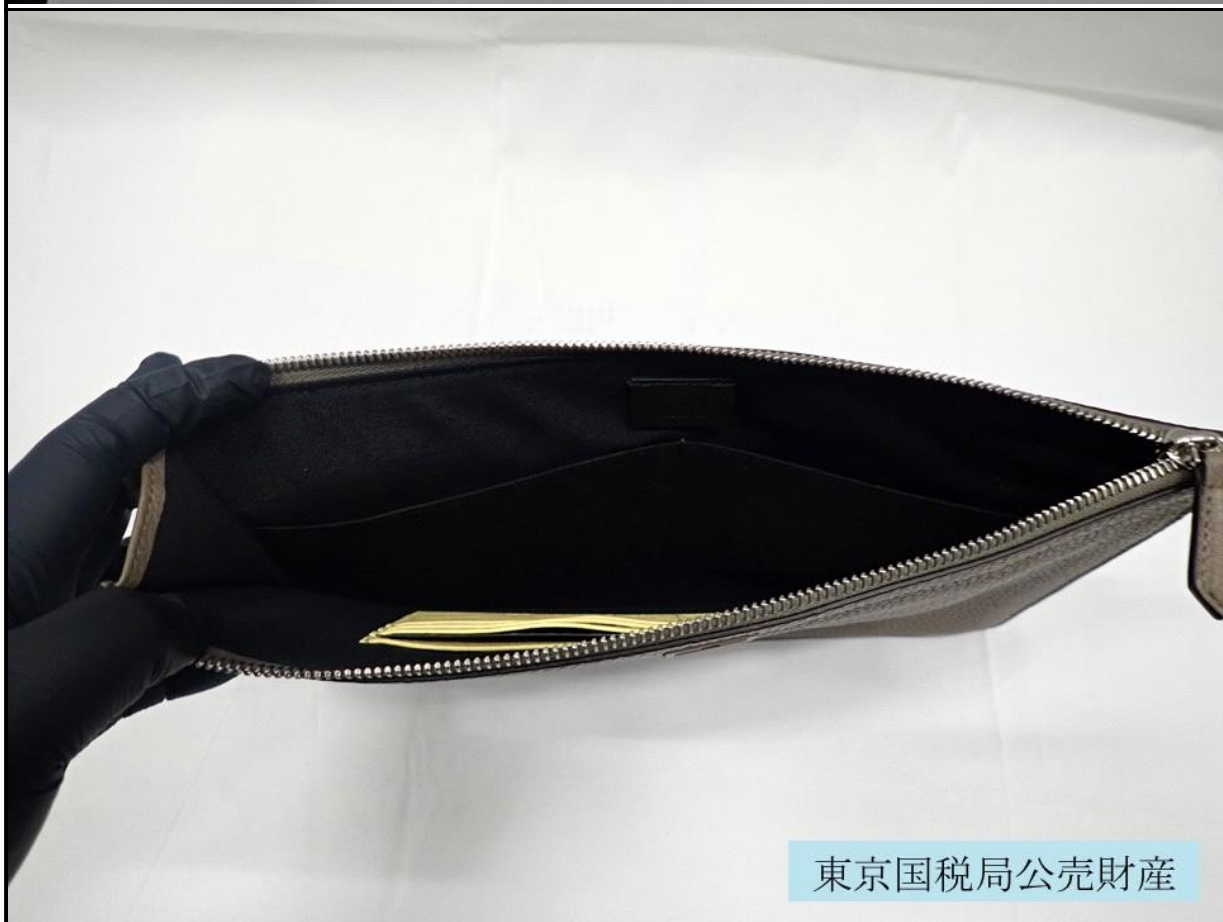
東京国税局公売財産