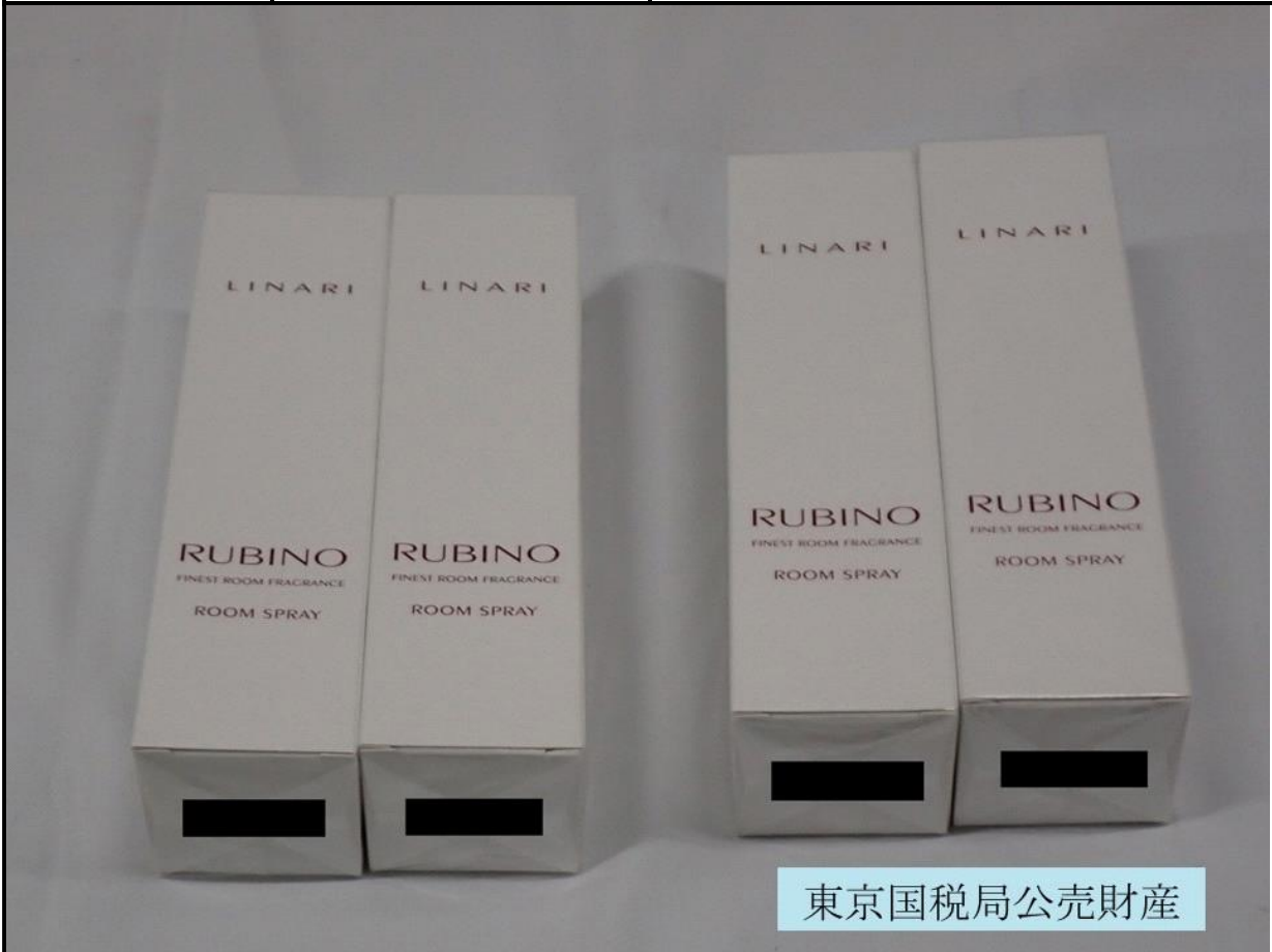
東京国税局公売財産