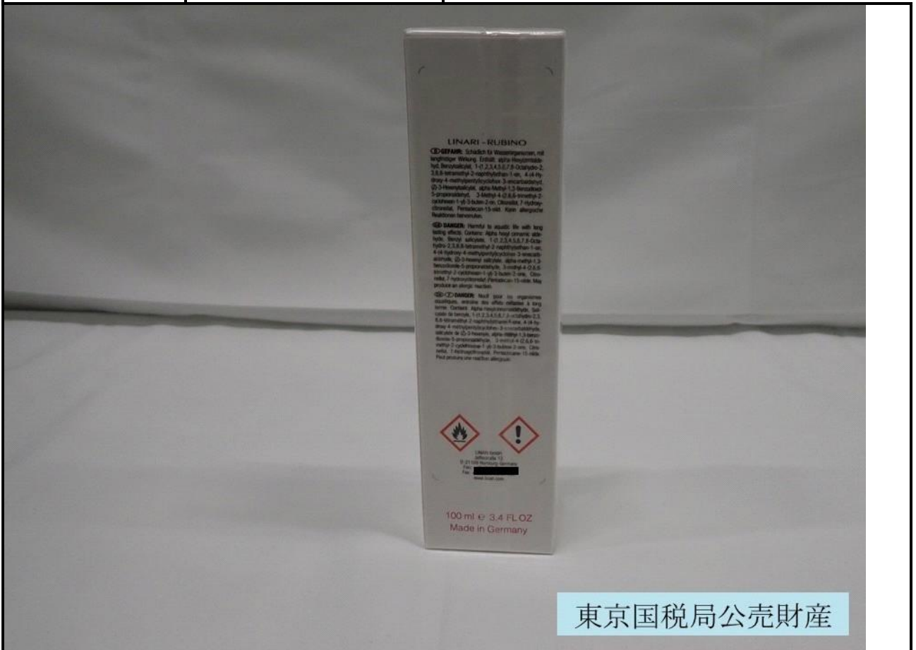
東京国税局公売財産