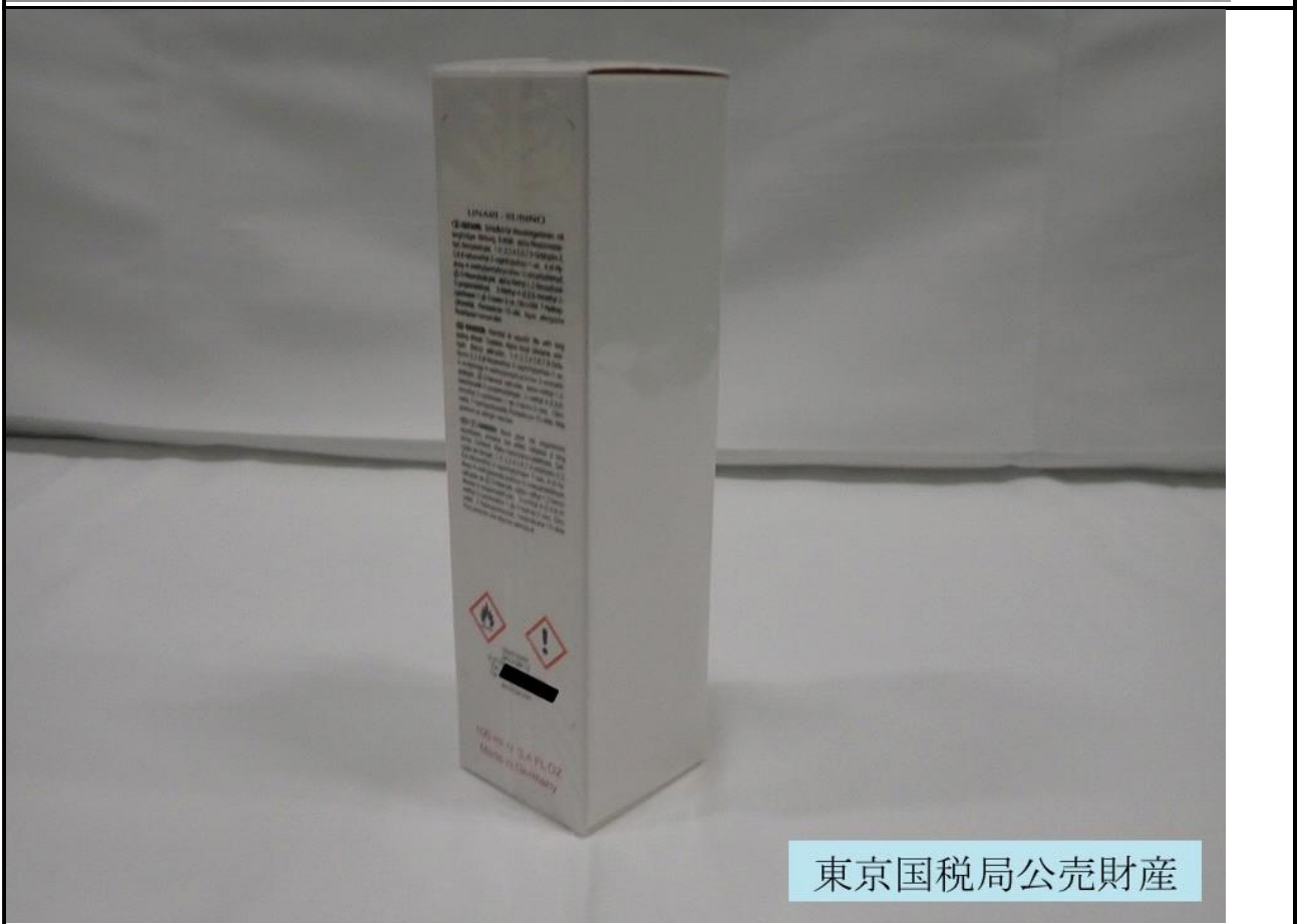
東京国税局公売財産