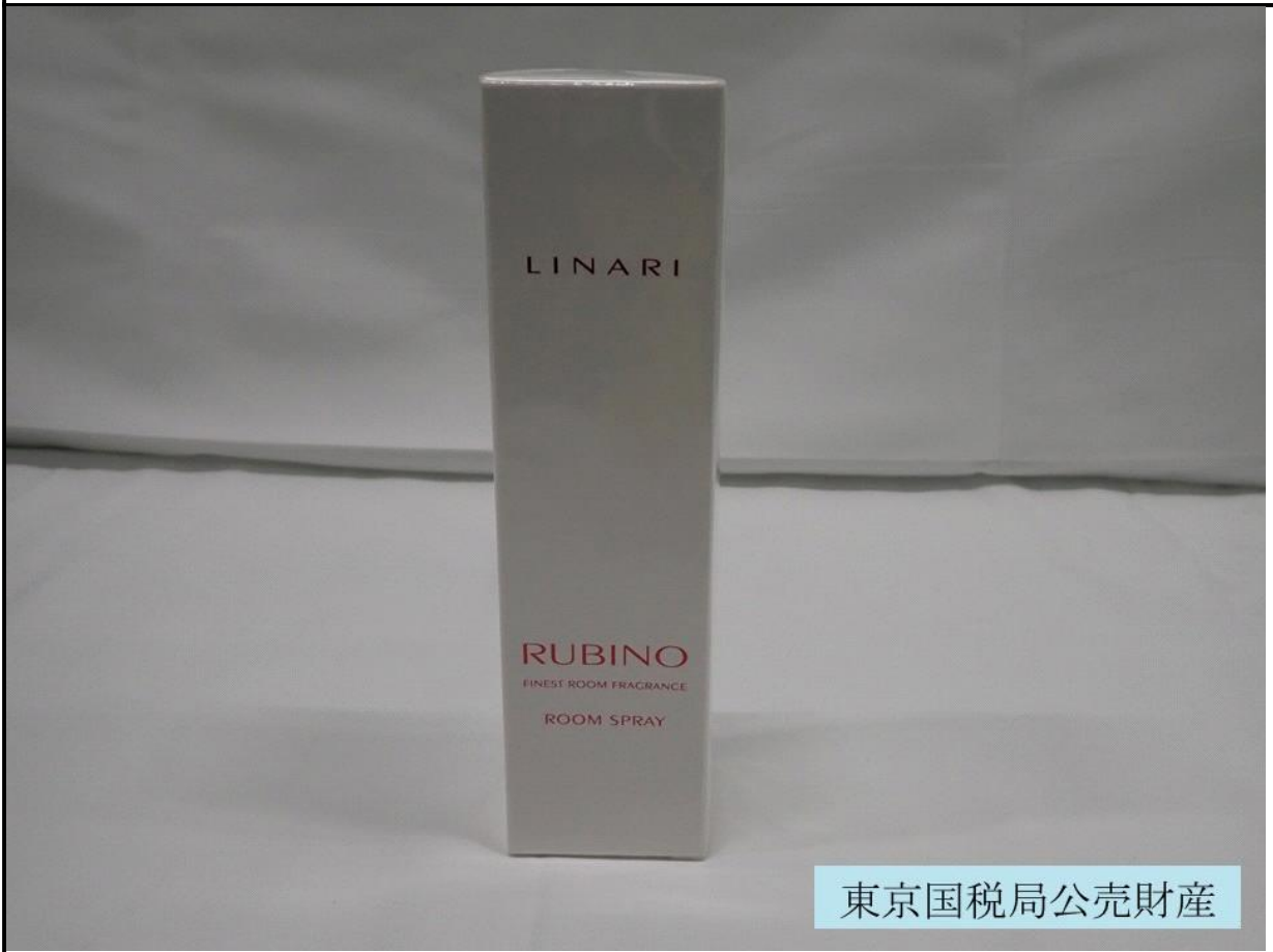
東京国税局公売財産