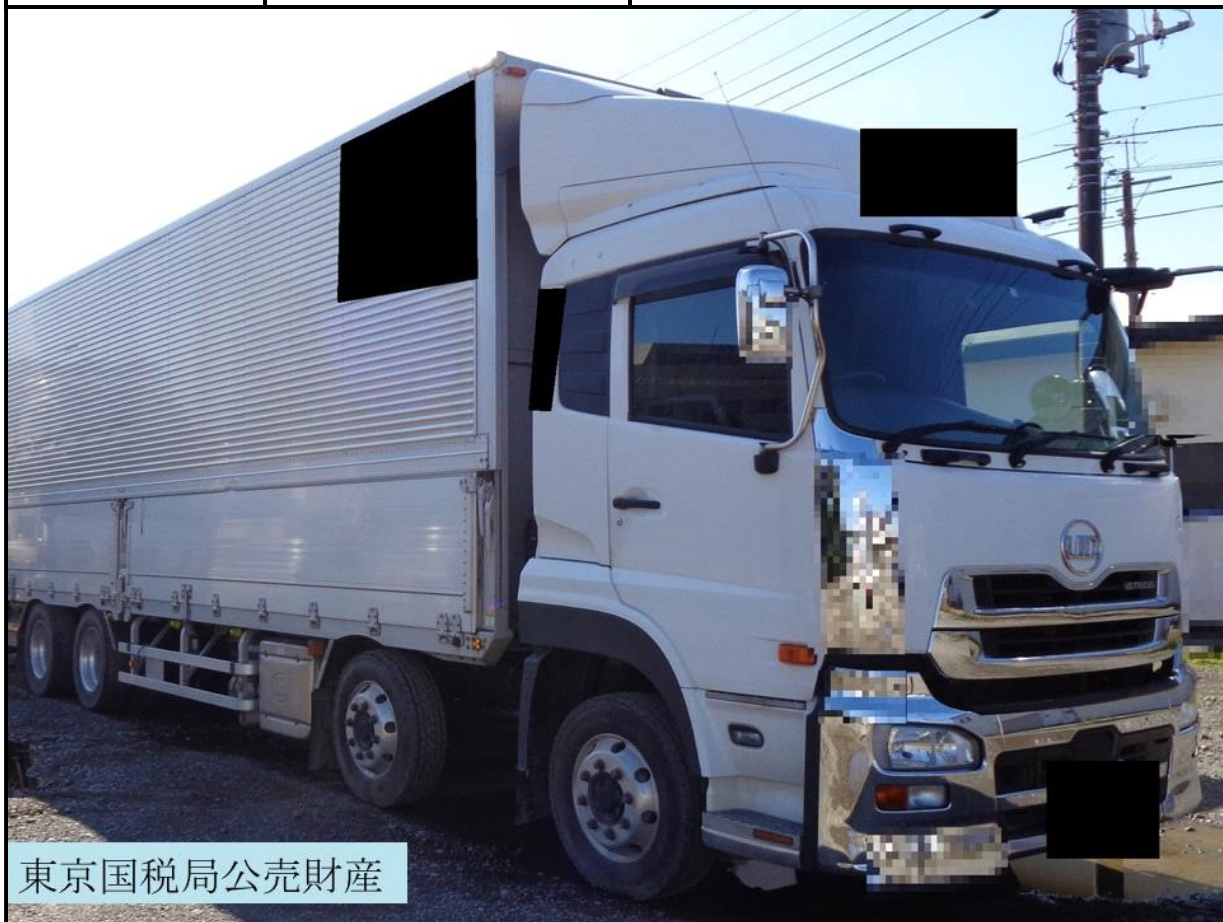
東京国税局公売財産