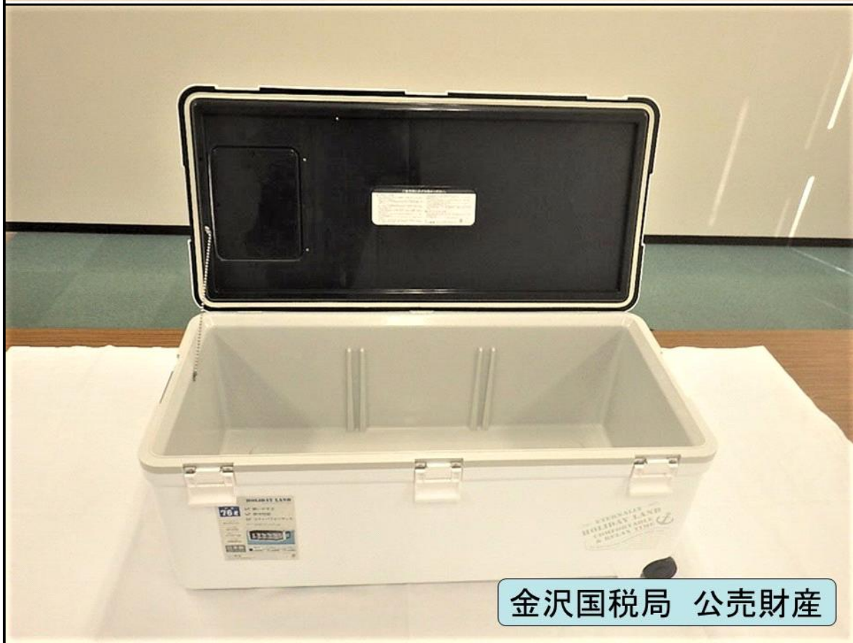
金沢国税局 公売財産