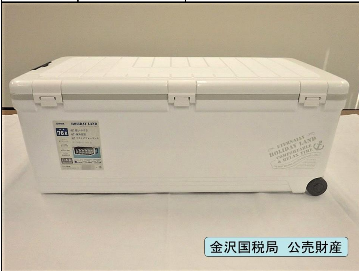
金沢国税局 公売財産