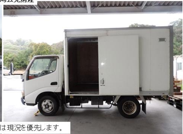
(注) 画像と現況が異なる場合は現況を優先します。