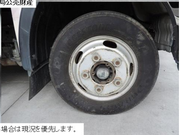
(注) 画像と現況が異なる場合は現況を優先します。