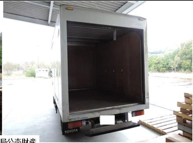
福岡国税局公売財産