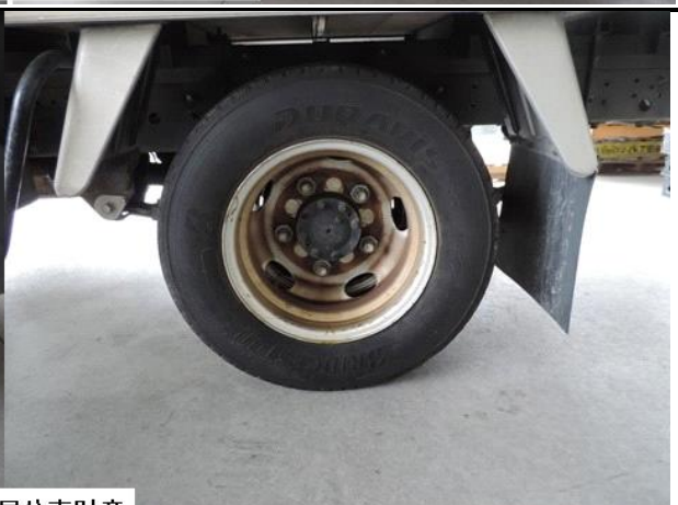
福岡国税局公売財産