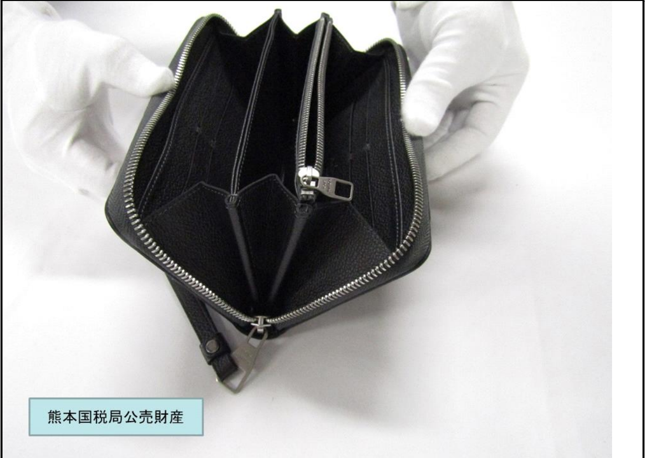
熊本国税局公売財産