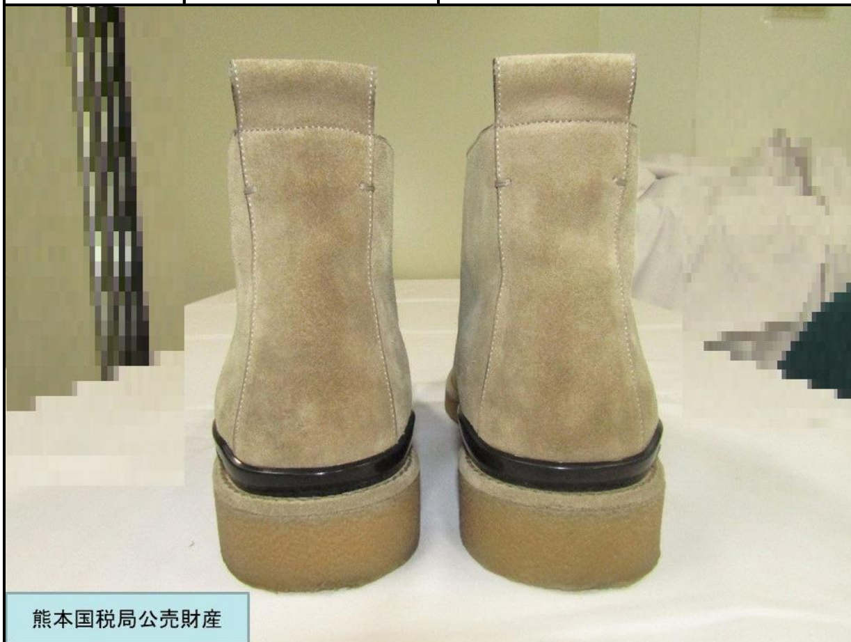
熊本国税局公売財産