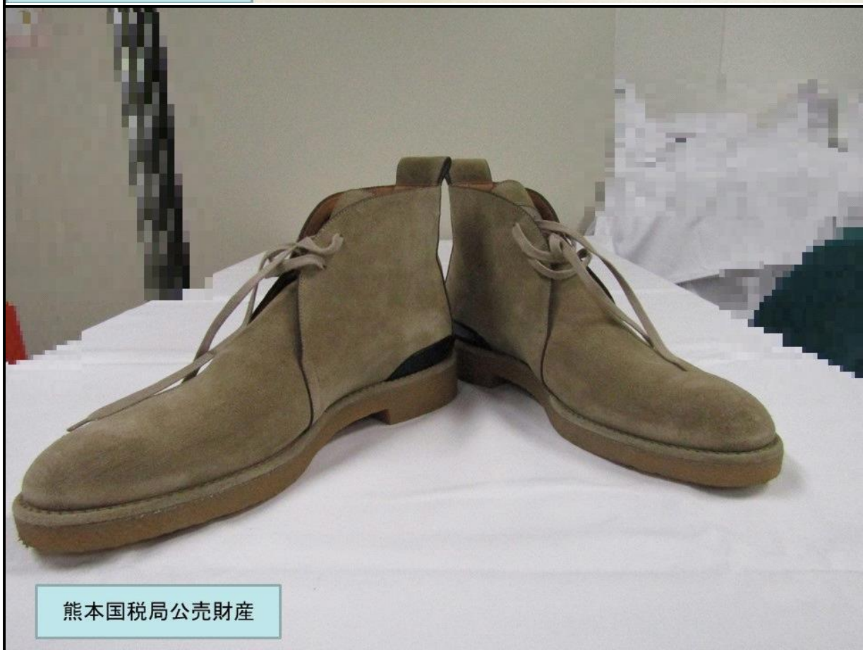
熊本国税局公売財産