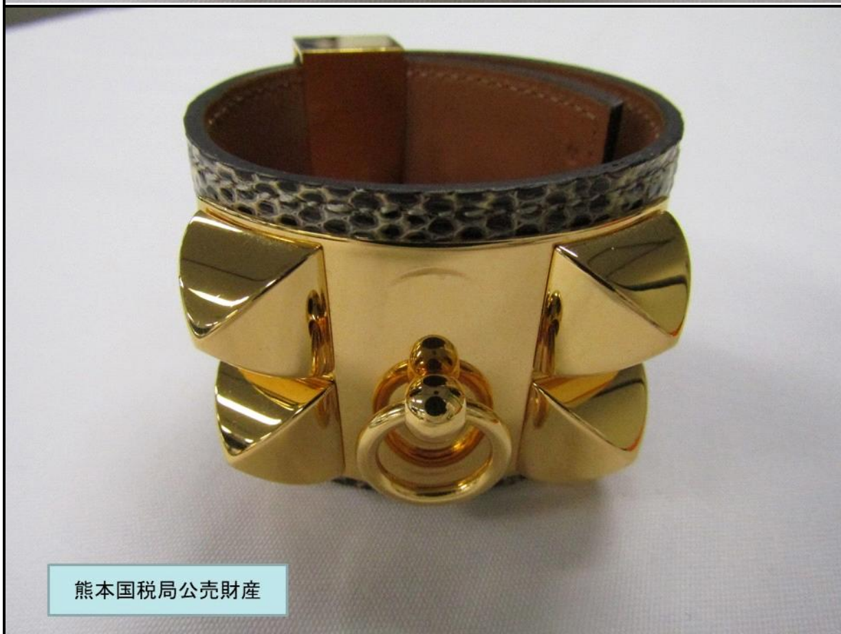
熊本国税局公売財産