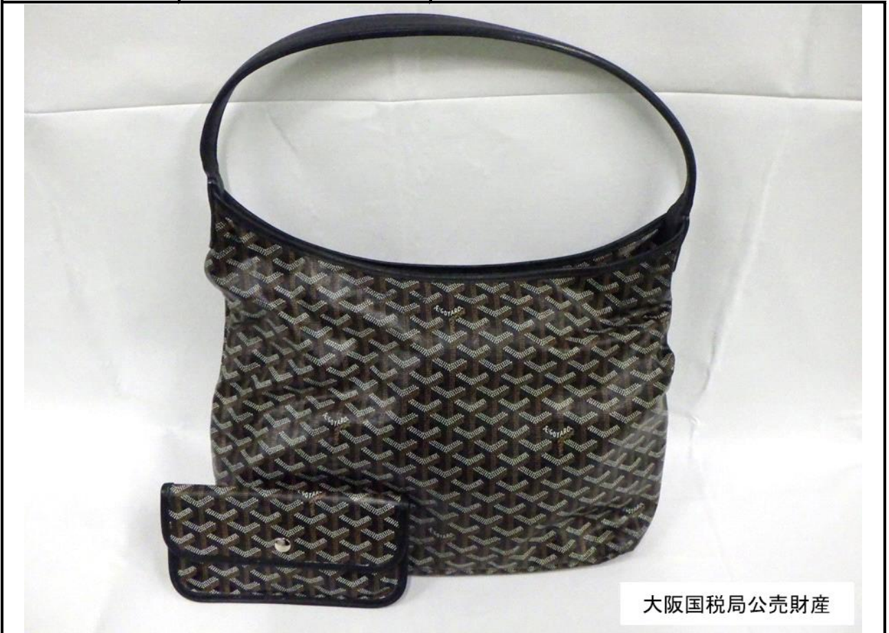
大阪国税局公売財産