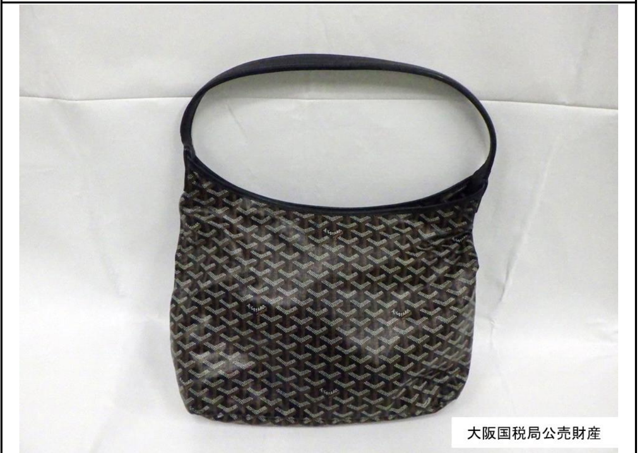
大阪国税局公売財産