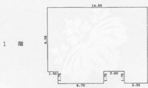
一棟建物各階平面図

家屋番号 清水町 36-2-31-8, 10-3-6 1/12.6.10 建物の所在 神戸市兵庫区清水町10番地3