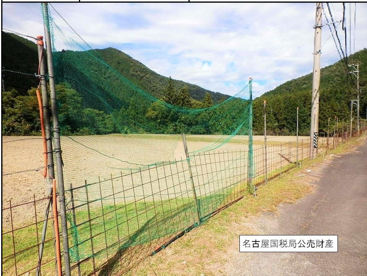
名古屋国税局公売財産