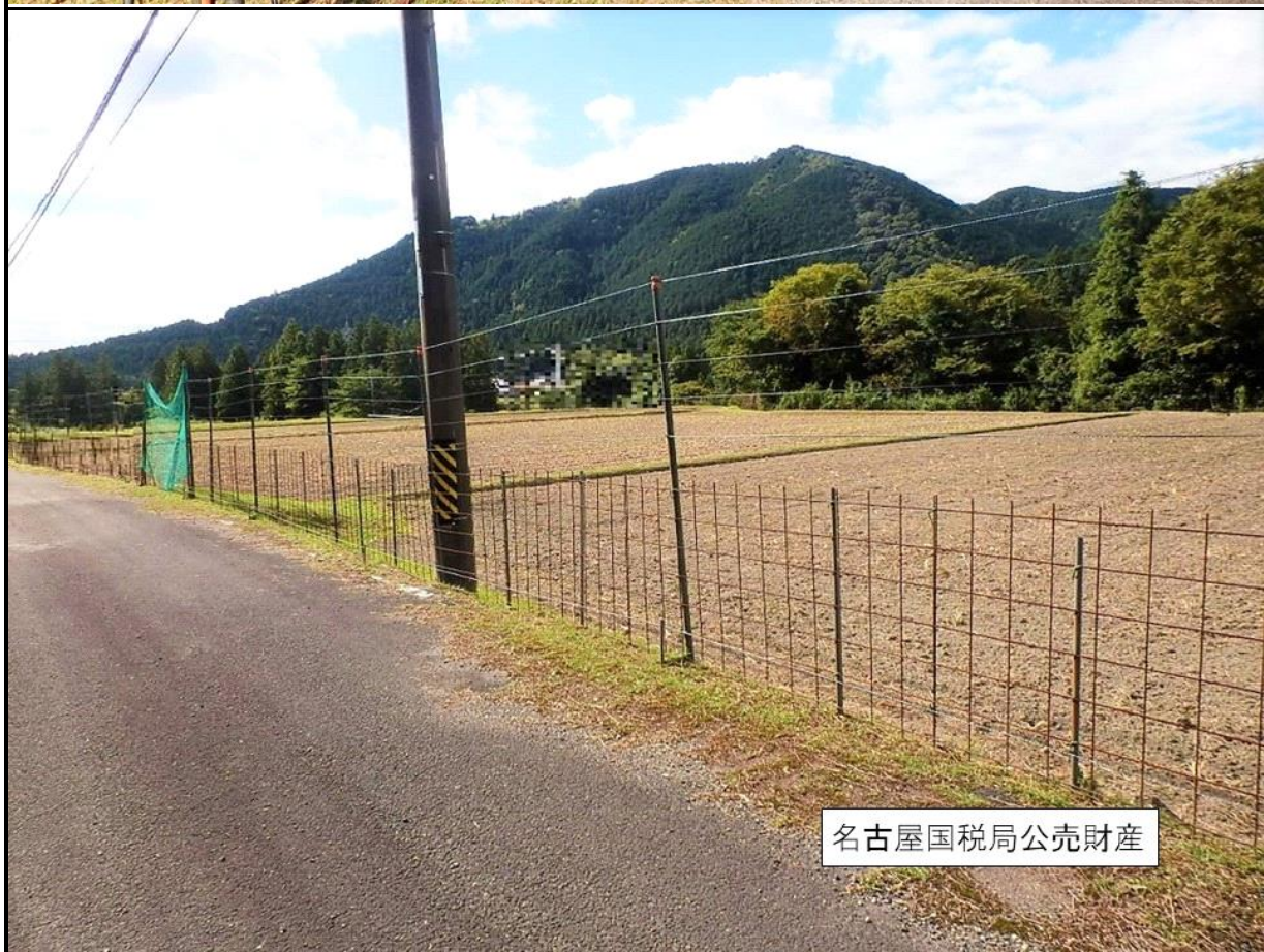
名古屋国税局公売財産