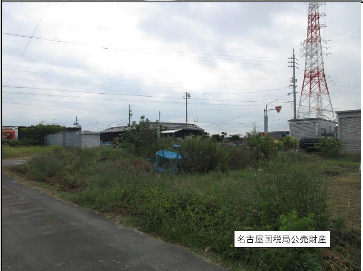
名古屋国税局公売財産