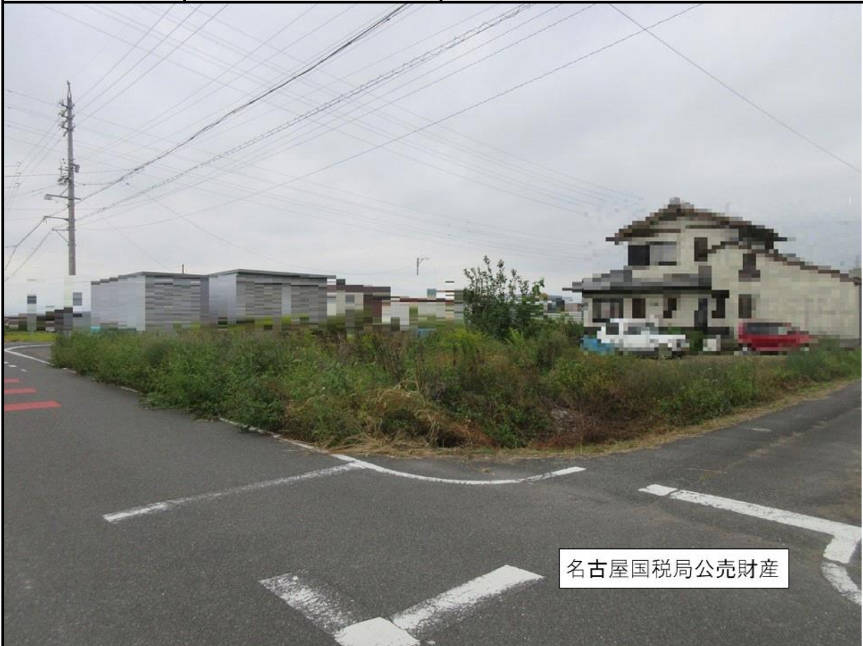
名古屋国税局公売財産