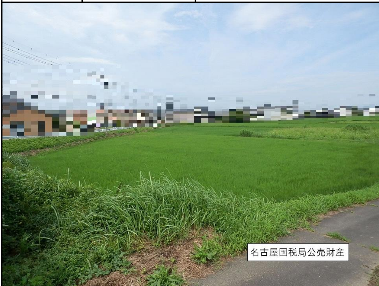
名古屋国税局公売財産