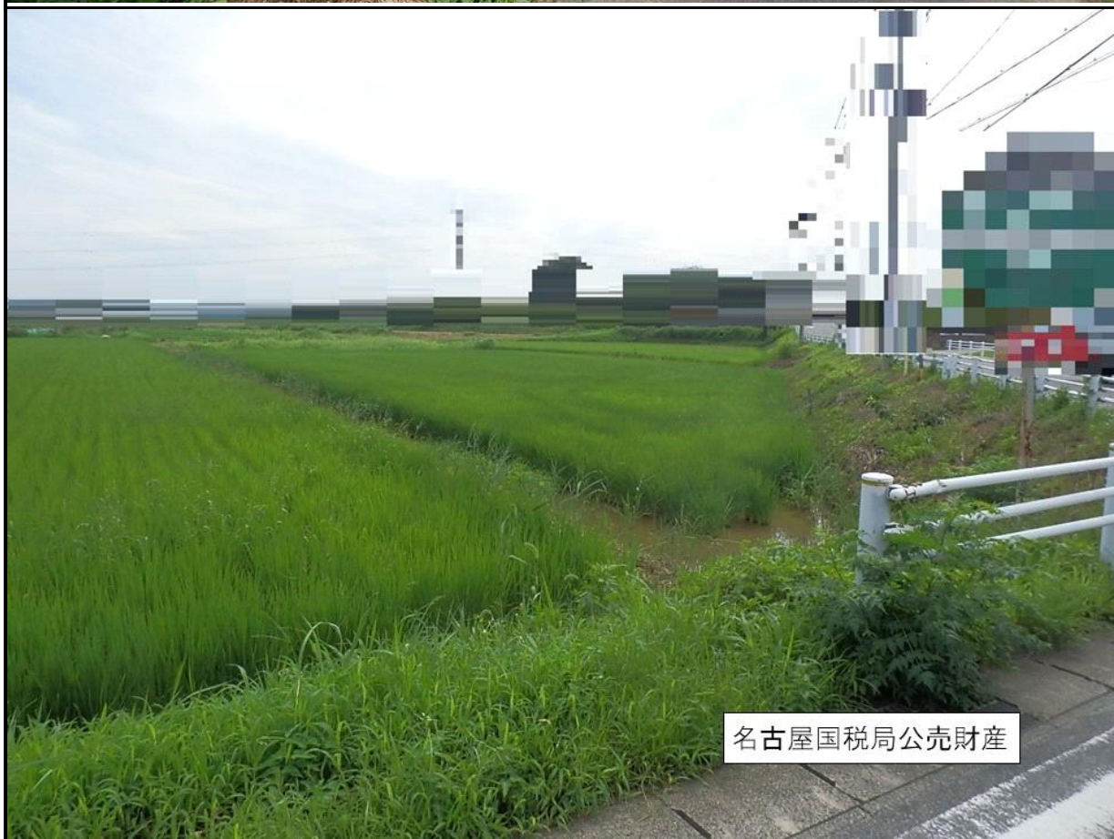
名古屋国税局公売財産