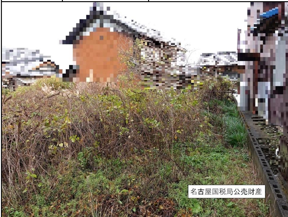
名古屋国税局公売財産