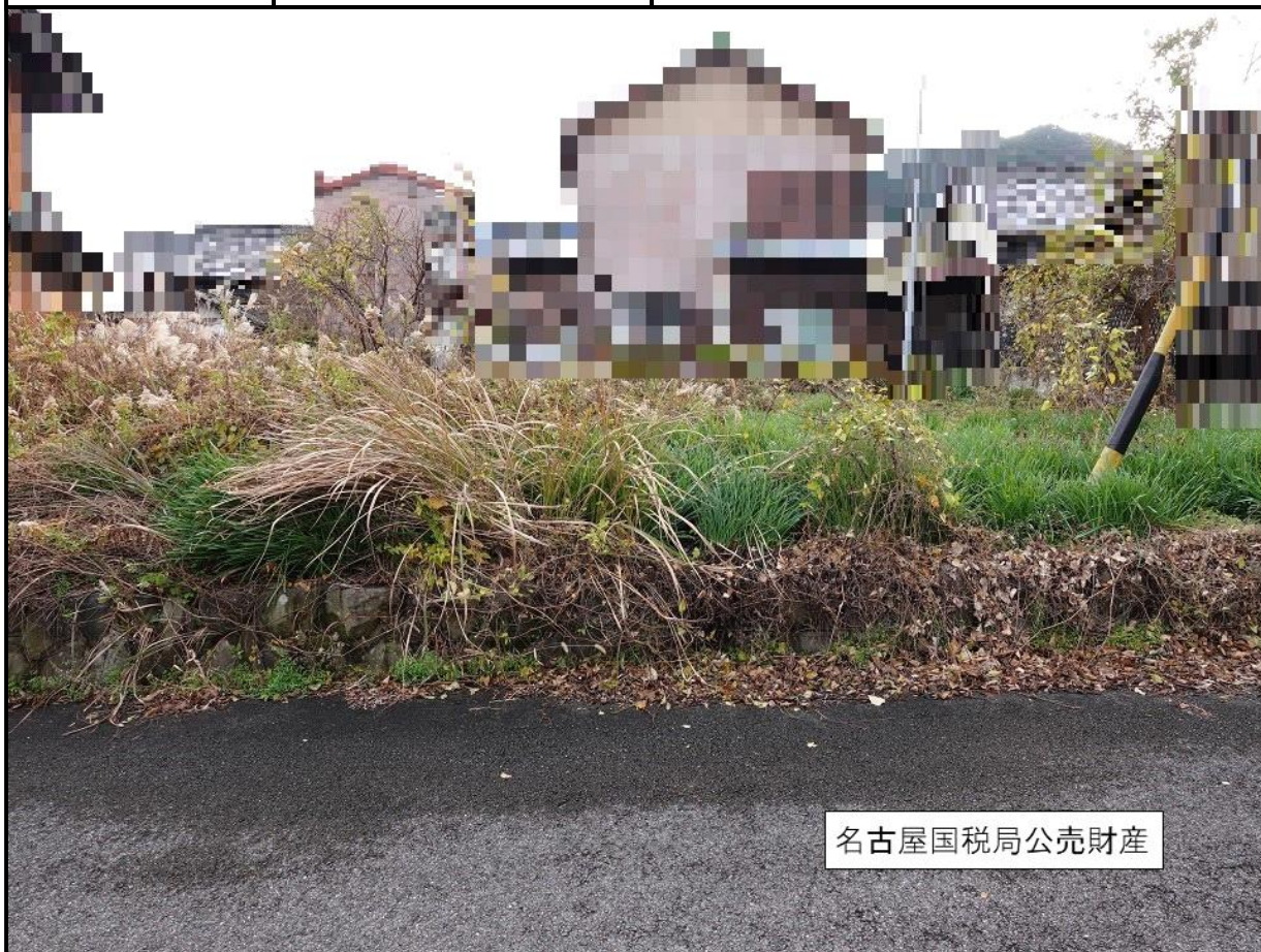
名古屋国税局公売財産