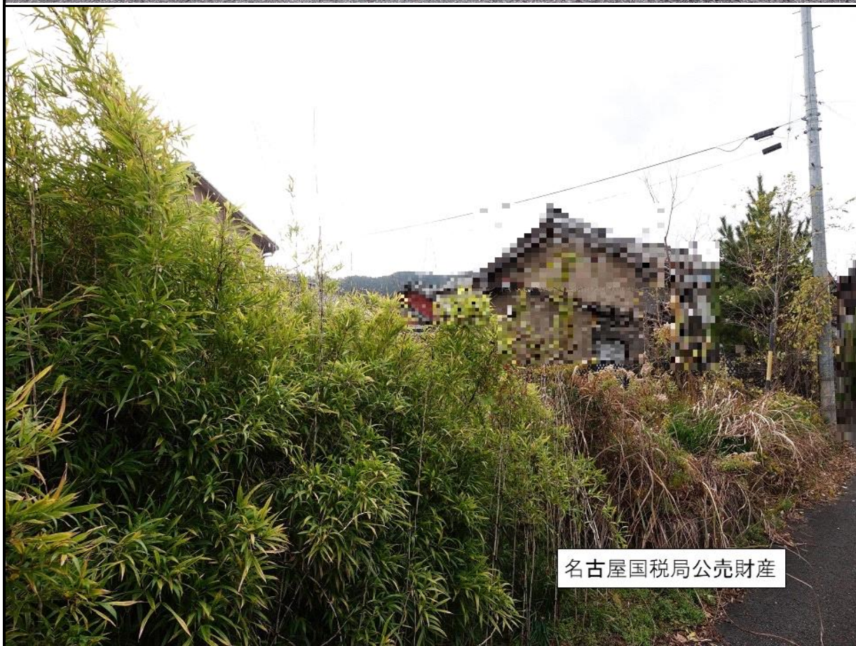
名古屋国税局公売財産