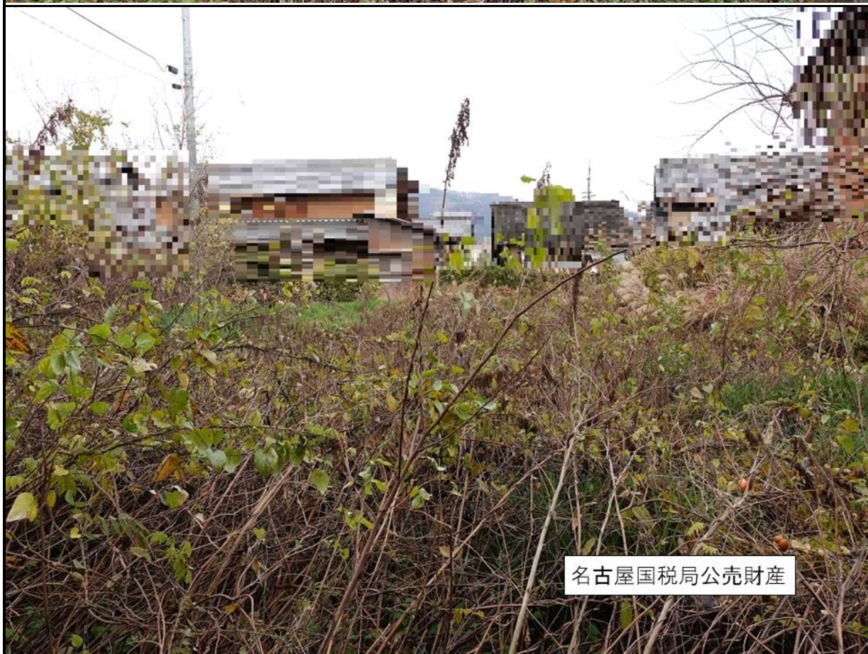
名古屋国税局公売財産