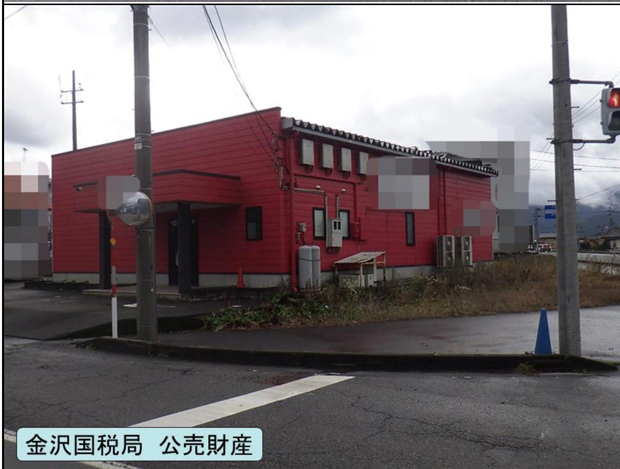
金沢国税局 公売財産