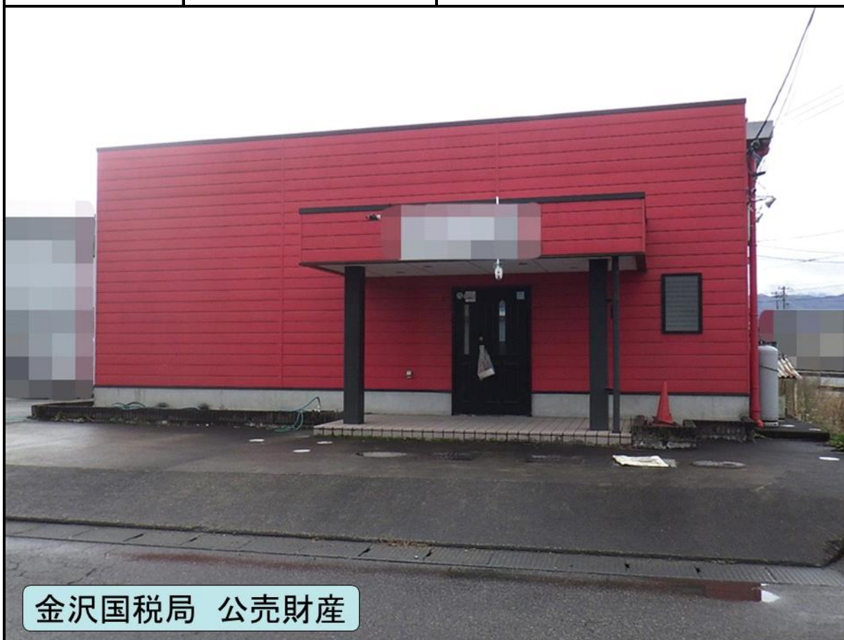
金沢国税局 公売財産