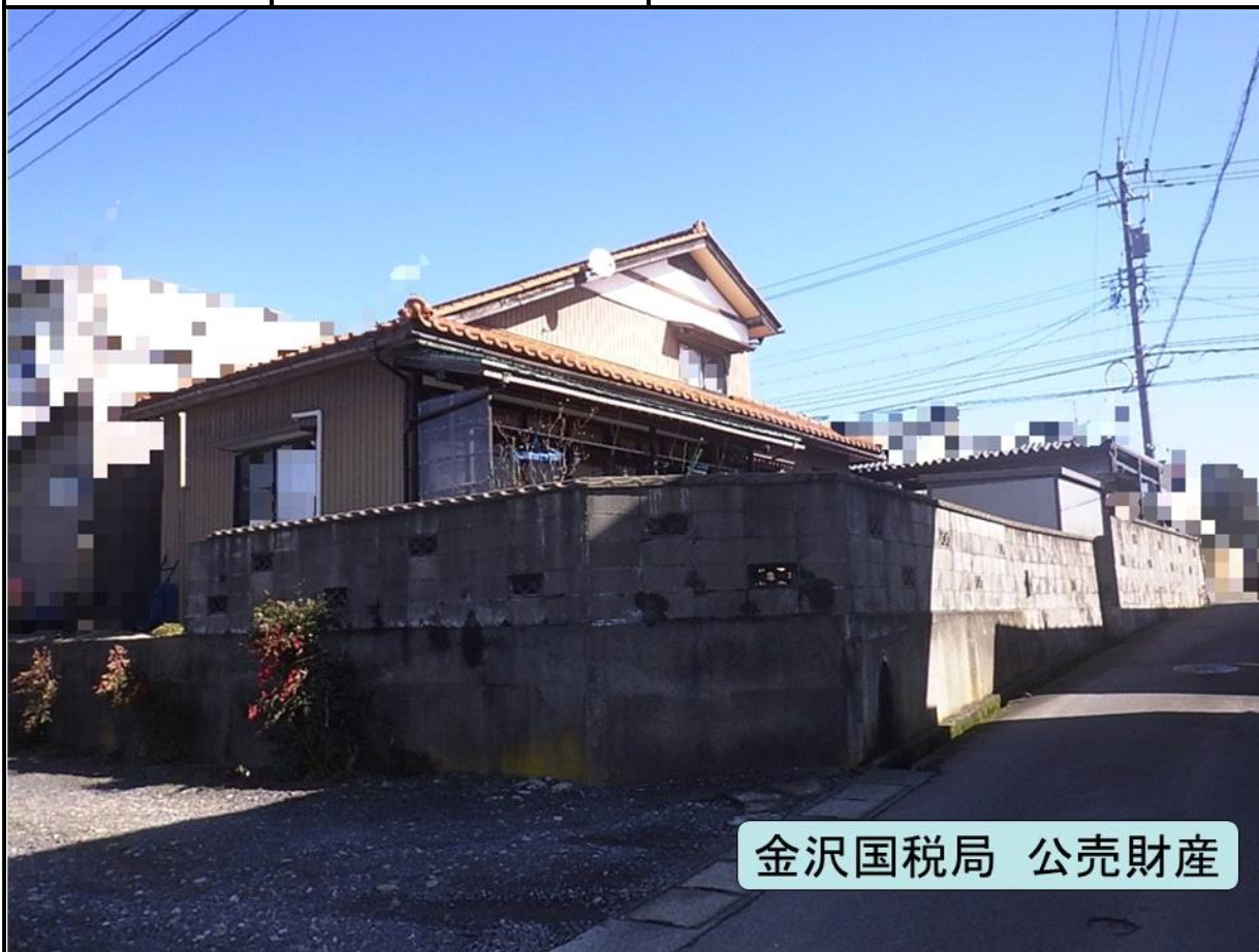
金沢国税局 公売財産