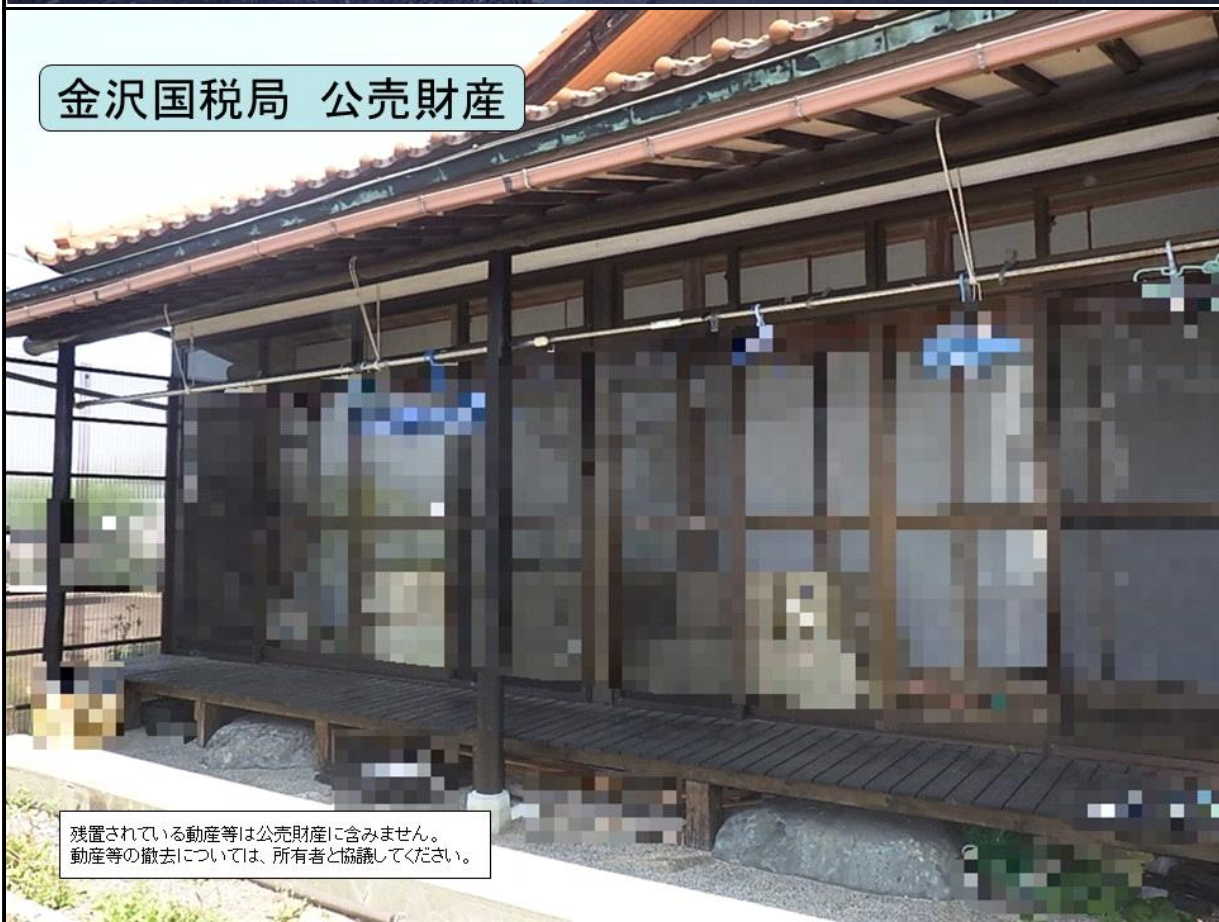
金沢国税局 公売財産

残置されている動産等は公売財産に含みません。 動産等の撤去については、所有者と協議してください。