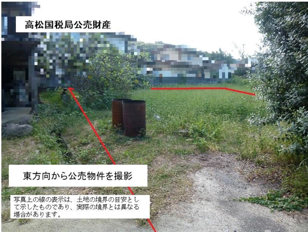
東方向から公売物件を撮影

写真上の線の表示は、土地の境界の目安として示したものであり、実際の境界とは異なる場合があります。