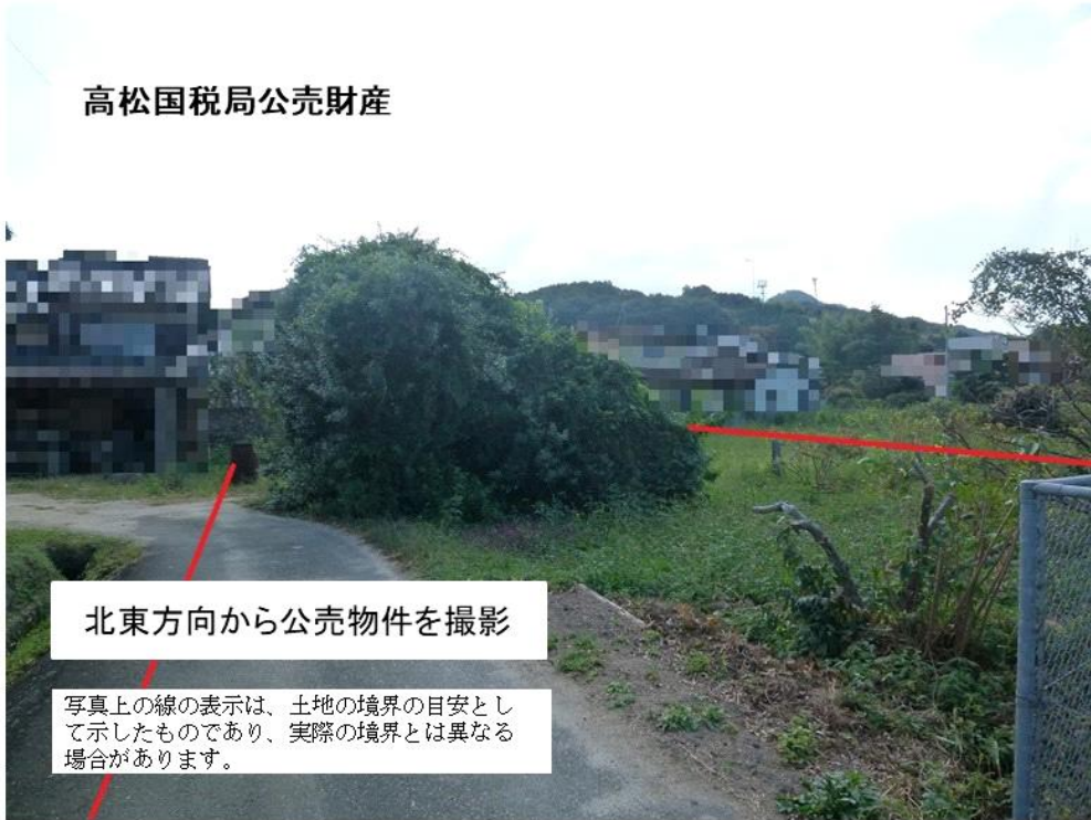
北東方向から公売物件を撮影

写真上の線の表示は、土地の境界の目安として示したものであり、実際の境界とは異なる場合があります。